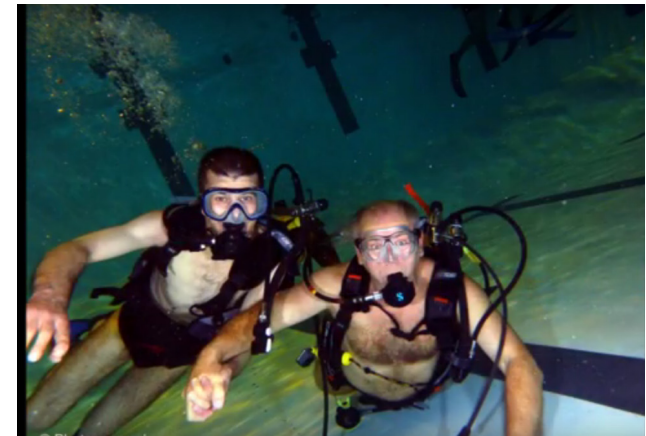
Sortie plongée avec les résidents dans le cadre d'un cycle sur les océans et la vie aquatique