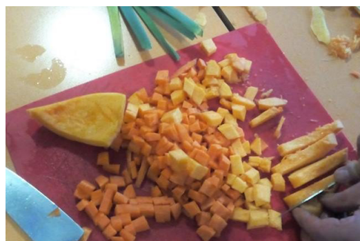
Atelier cuisine durable et solidaire