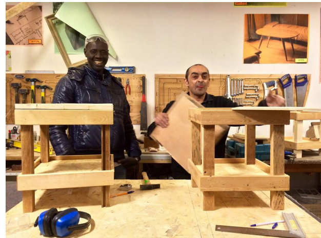
Atelier menuiserie solidaire dans les locaux de l'association Extra-muros

Si la diversification des publics et des lieux d'intervention a toujours été un objectif affiché par l'association, c'est bien l'année 2016 qui nous aura permis de concrétiser cette ambition, avec l'ouverture d'un premier partenariat avec un Centre d'Hébergement et de Réinsertion Sociale (CHRS): la Résidence du Chemin Vert (communément appelée «l'Îlot»), spécialisée dans l'accueil de personnes sortants de prison.