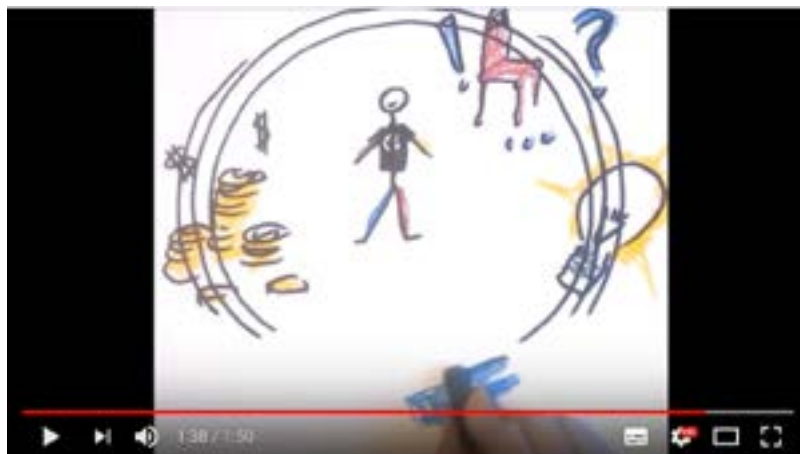
campagne d'adhésion Champ libre 2017

Enfin, Champ Libre s'est lancé dans un processus de clarification de son organisation avec à la clé la définition d'un organigramme précis pour permettre aux bénévoles de mieux se situer et, in fine, de pouvoir s'impliquer davantage dans son fonctionnement. 2017 a donc été une année très riche pour l'association qui possède désormais une structure à la hauteur de ses ambitions. Champ Libre reste cependant une association reposant avant tout sur le bénévolat de ses membres, dont la mobilisation constitue un objectif à part entière de l'association et sans lesquels aucune action concrète ne serait possible.